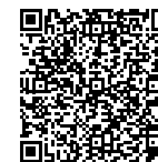
Hier geht es zu unserem aktuellen Freizeitprogramm:

Unsere aktuellen Freizeitangebote senden wir Ihnen gern zu. Sie finden sie jedoch auch auf unserer Homepage unter den Angaben zu den Kontakt- und Informationsstellen.